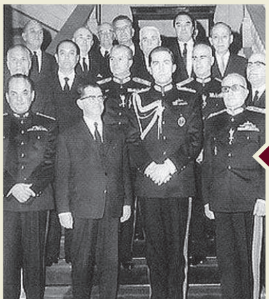
Крал Константин II (трети отляво надясно на първия ред), заобиколен от правителството на хунтата, на церемонията по клетвата.

Това са само две от подигравателните имена, с които в Гърция масово назовават последния си крал от династията Шлезвиг-Холщайн-Зондербург-Глюксбург. Ако има съвременен монарх, изпитал всички беди при създаване на републиката, това вероятно е той, Константин Втори. Не го пускат, пускат го, гонят го. Карат го да се кълне във вярност на престъпна хунта, кълне се от слабост, отказва се. Бяга из страната, вдига бутафорно въстание, за което май само той научава. Уплашен, бяга извън страната (това не се прощава на държавен глава!). Подиграват му се непрестанно. Дават му дворци, вземат му ги. Ходи от съд на съд, от кралски двор на кралски двор. Не му дават паспорт (защото твърди, че няма фамилно име). Конфискуват му всичко. И накрая, сякаш всичко дотук не е достатъчно, Съдът в Страсбург изобретява последното унижение.